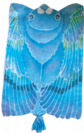
ランチョンマット：ハト・40cm×20cm