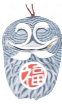
〈カラフトフクロウ〉