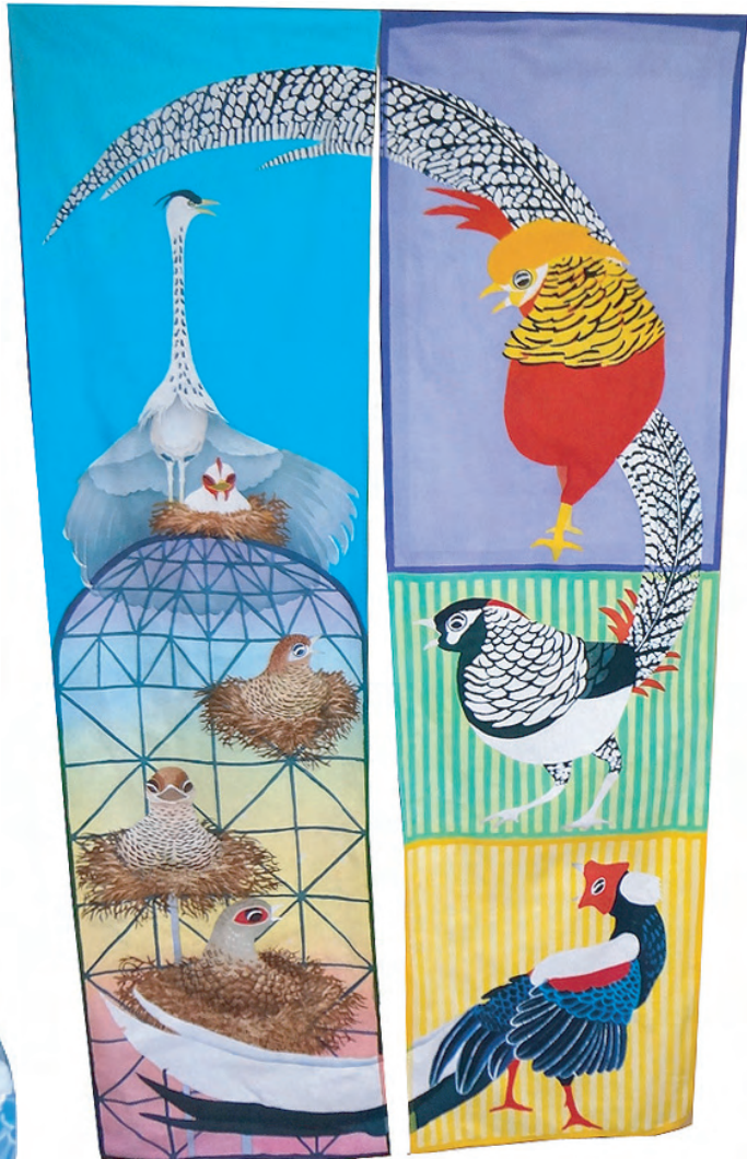
キンケイ・ギンケイ・サンケイ：150cm×43cm