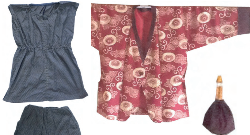
着物のリフォーム

ストール： 使い物にならなかったミシン刺繍糸を3本でかぎ編みました。 待ち時間などを利用しつつこつこつと何年もかかりましたが、月賦で買ったミシンのおまけが無駄にならずにすみました。