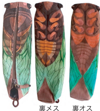
クマゼミ・ペンケース：17cm

きらっとさん恒例のアマチュアイベントが開催中にあります。開催日未定、興味のある方は北川が「きらっと」さんまで問い合わせして下さい。