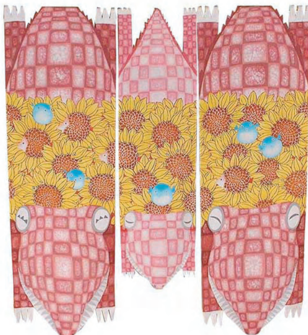
ヒマワリとヒマワニ：

2005年朝日クラフト展入選作品ですが、ほとんど展示をしたことがなく、楽しい染めもんも一区切りですので、皆さんに見てもらおうと思いました。題名に深い意味はありませんが、染めもんやの原点、理屈抜きに楽しいです。