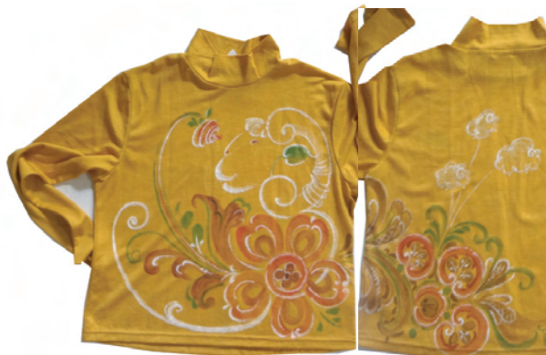
手描きシャツ：ひつじ年に描き始め、やっと仕上がりました。

オーバーブラウスとパンツ：夏物の一重で風通しがいい生地でした。首周りの切れ込みも利用し、ほとんど直線縫いで時間をかけずに仕上げました。おかげでこの暑い夏に間に合いました。