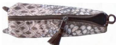
フクロウペンケース：17cm

今年の鳥キャラは制作を始めると意外と難しく、鳥に見えないなあと思いつつ仕上げましたが、時間が経ってみますと、それほどでもないかと今は気にしています。